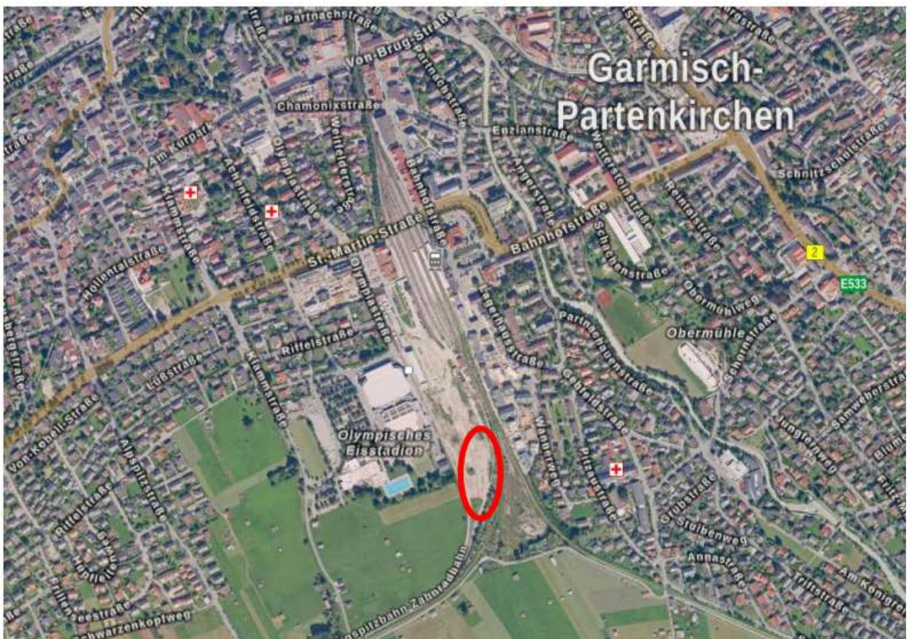
Abb 1: Luftbild mit Lage der Planungsflächen (roter Kreis); (Bayern Atlas 2022), Darstellung unmaßstäblich

hier: Bekanntmachung der öffentlichen Auslegung (gem. § 2 Abs. 1, § 3 Abs. 2 BauGB)