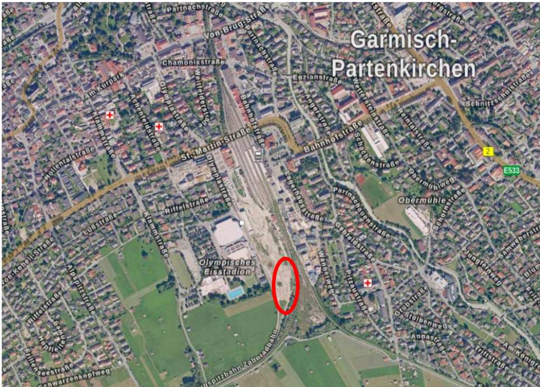
Abbildung 2, ohne Maßstab: Luftbild mit Lage der Planungsfläche (roter Kreis); (BayernAtlas 2022)

Im Osten wird der Umgriff von der Bahnlinie Garmisch-Partenkirchen - Griesen eingegrenzt. Im Norden wird parallel der Bebauungsplan Nr. 101 A „Bahnhofsareal West (Bereich Süd – Teil 1)“ ausgewiesen. Die Bahntrassen setzen sich nach Südwesten hin fort.