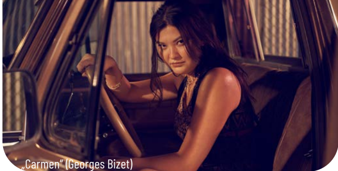
„Carmen“ (Georges Bizet)

SO / MO, 21. / 22.1., 17 / 17.30 bzw. 19.30 / 20 Uhr